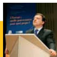
Conférence de M. Barroso , Président de la Commission européenne, à l'occasion du 10ème anniversaire du CEES et du 60ème anniversaire de l'ENA

Un rapport d'activités complet, détaillant pôle par pôle l'ensemble des actions menées en 2005 est en libre téléchargement sur le site Internet du CEES à l'adresse : http://www.cees-europe.fr/fr/CEES/rappac.php