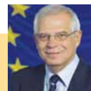
Conférence de M. Borrell Fontenelles , Président du Parlement européen, dans le cadre des 2èmes Rencontres européennes de Strasbourg