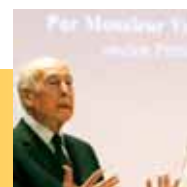
Conférence de M. Giscard d'Estaing , ancien Président de la République française, dans le cadre des 2èmes Rencontres européennes de Strasbourg